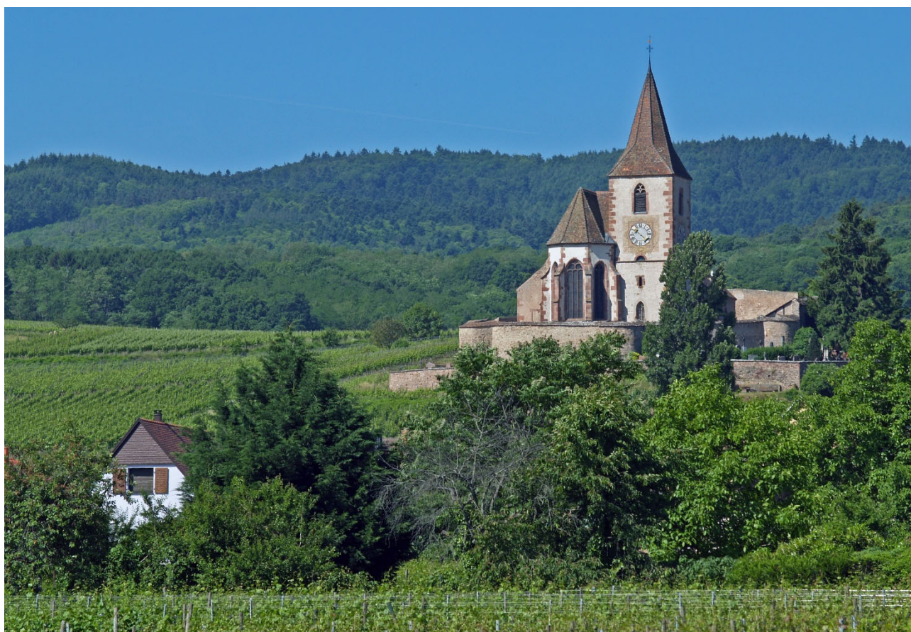
Das Wehrkirchlein in Hunawihr im Elsaß.

PROBIERPAKET. Es beinhaltet je 1 Flasche der oben aufgeführten 14 Weine und kostet 264 Euro (versandkostenfrei innerhalb BRD).